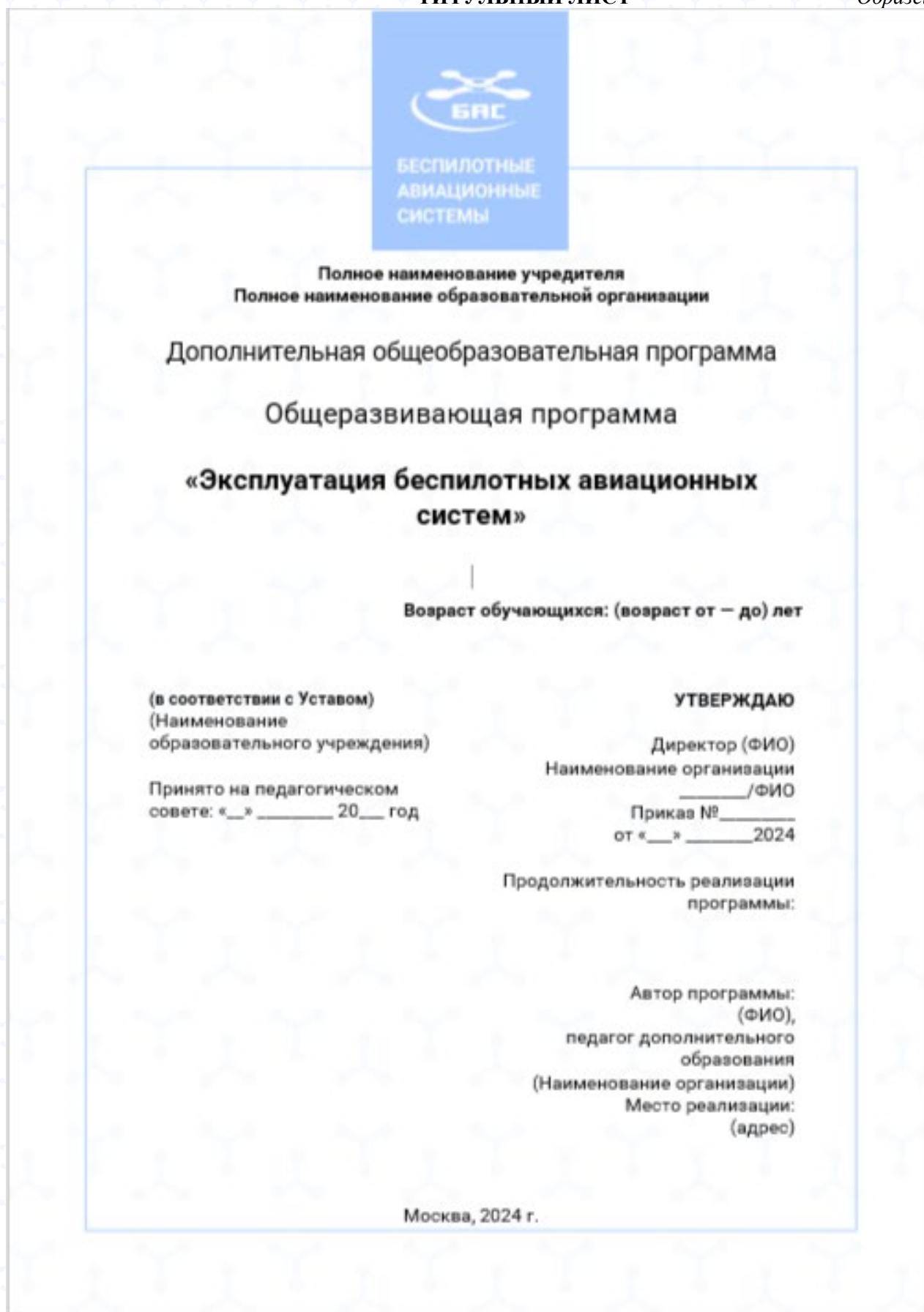
Рисунок 1. Образец титульного листа Программы